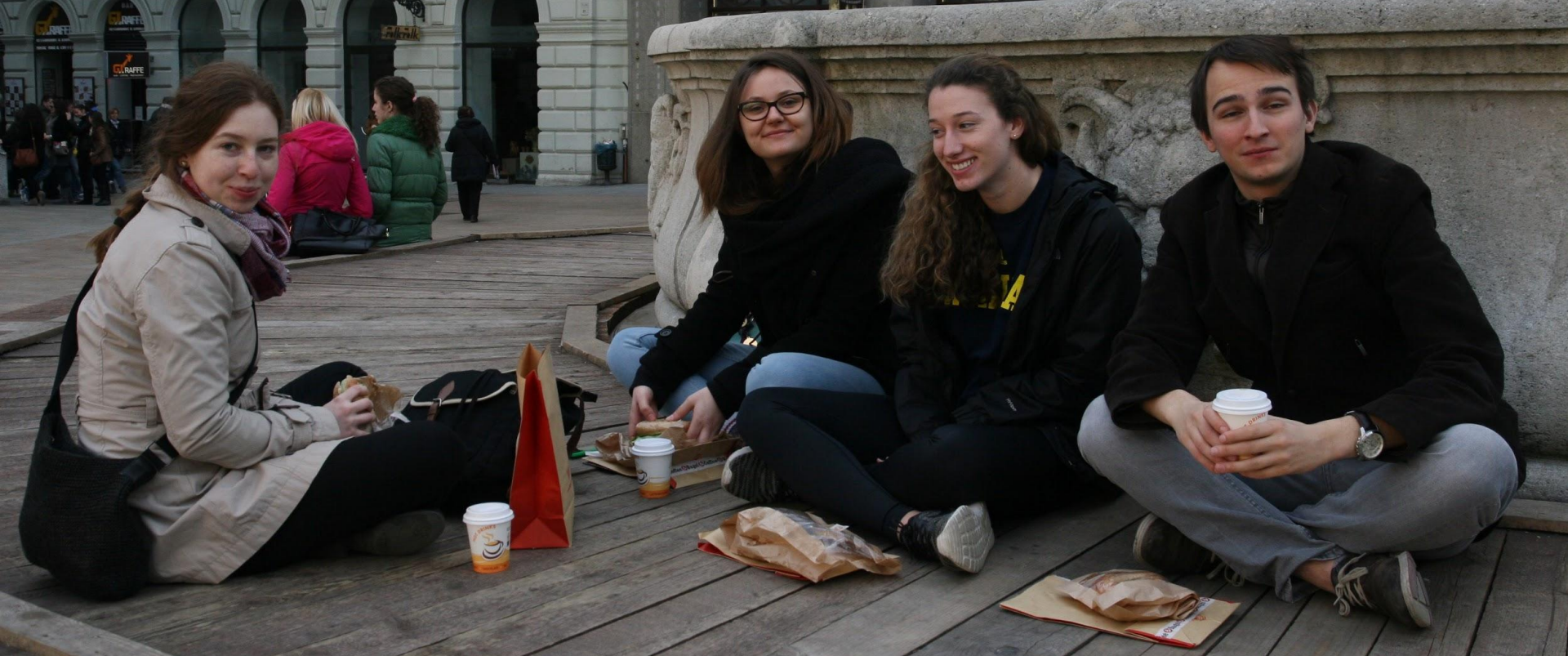
Nebo i dál (Bratislava)